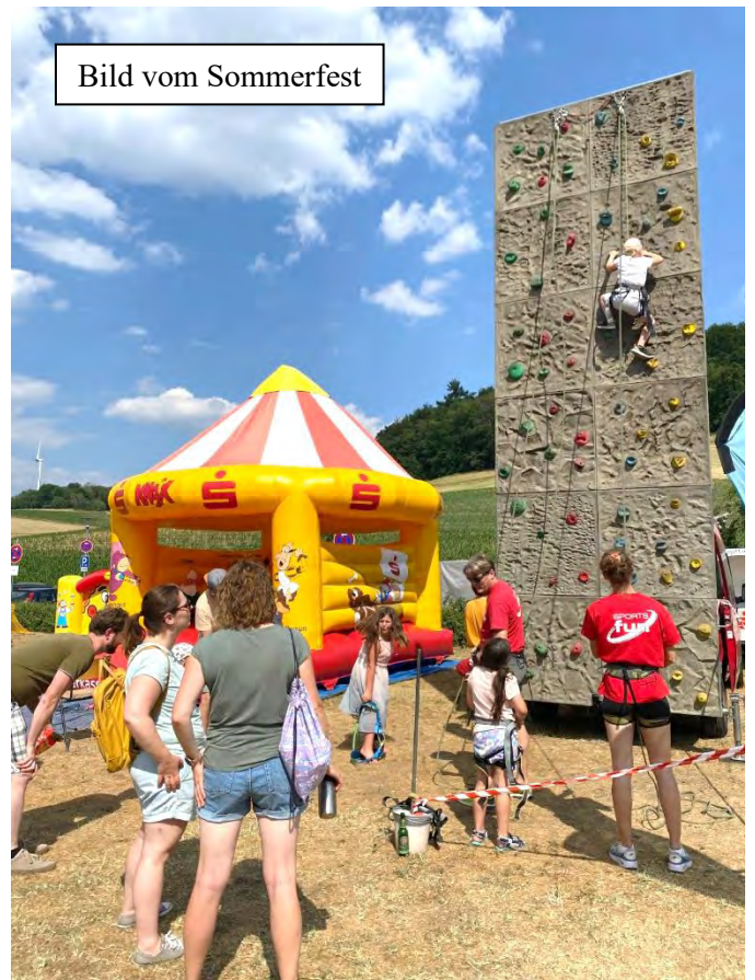
Bild vom Sommerfest